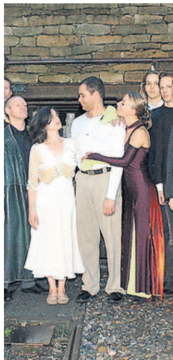
Die Ruhrgebietsoper „Orpheus im Schacht“ hat heute Premiere